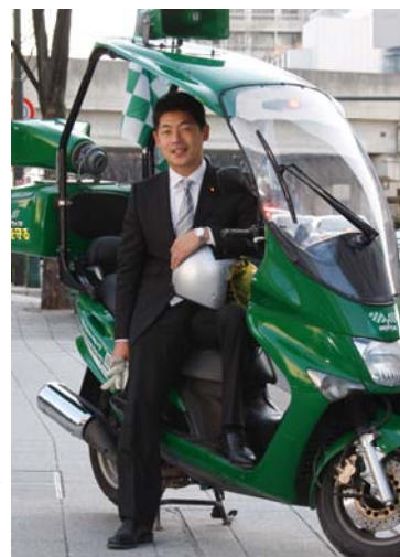
街宣バイク「ケンタ号」と

自民党がしっかりしないと、永住外国人への参政権付与のような危険な政策に追い風となるのだから。